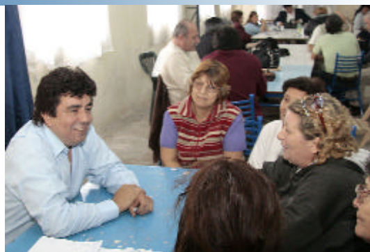
El Intendente junto a vecinas de González Catán.