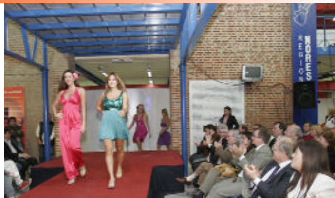
Desfile en la Fiesta Nacional del Calzado.

"El Polo contará con aproximadamente 60 hectáreas, ofrecerá todos los servicios para el desarrollo de una industria que se proyecta tanto a nivel nacional como internacional, y estará ubicado