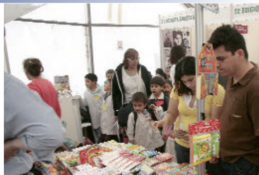
Visitantes a la Primera Feria del Libro en La Matanza.

Las instituciones educativas del partido presentaron una expo-educativa y hubo stands reservados para autores locales y medios de información de La Matanza.